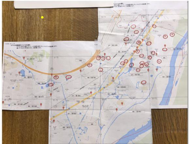
No2 サンプリングポイントの概略