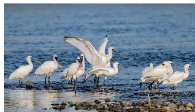
クロツラヘラサギ

ホームページ : https://www.facebook.com/Kiyonori.Ookura