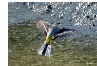
獲物をくわえたキセキレイ