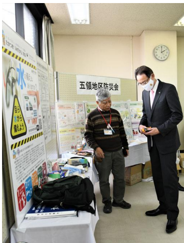
防災会会長が高槻市長に説明