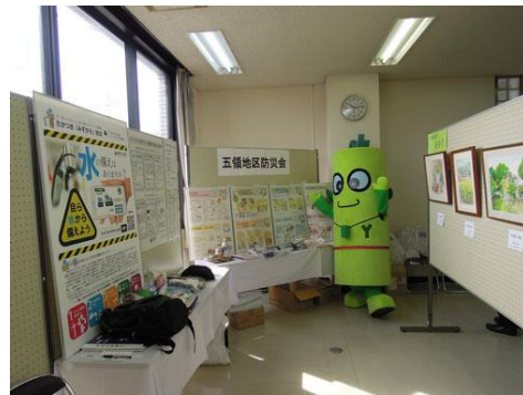
※ヨシちゃんは、鶯のヨシをイメージした五領地区のゆるキャラです。