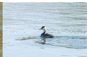
水に浮かんだら、こんな感じ