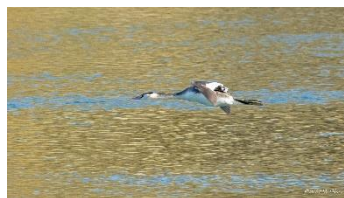
カンムリカイツブリの飛翔