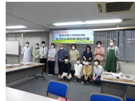
民医連検査技師の皆様