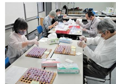
15分後、カプセル攪拌