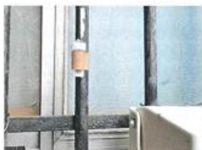
住宅地 (ガムテープ)