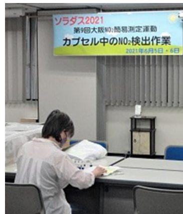
カプセル・記録表受付